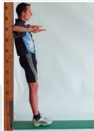
Repousser le haut du corps vers l'avant en rapprochant les omoplates. Au retour, elles ne touchent pas le mur.

Bibliographie: Bourban P., Hübner K., Meyer S.: Test de la force de base du tronc. Dans: mobile No 6/00, pp. 10 à 12, 2000.