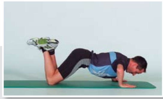
Fléchir et tendre les bras, garder le dos droit.