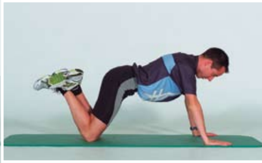
Appui facial sur les genoux, bras tendus.